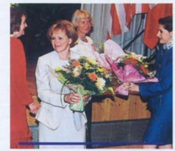
Les épouses des récipiendaires sont aussi à l'honneur